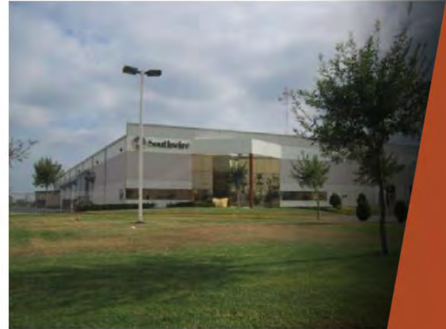
SOUTHWIRE PARQUE INDUSTRIAL STIVA AEROPUERTO APODACA, N.L..