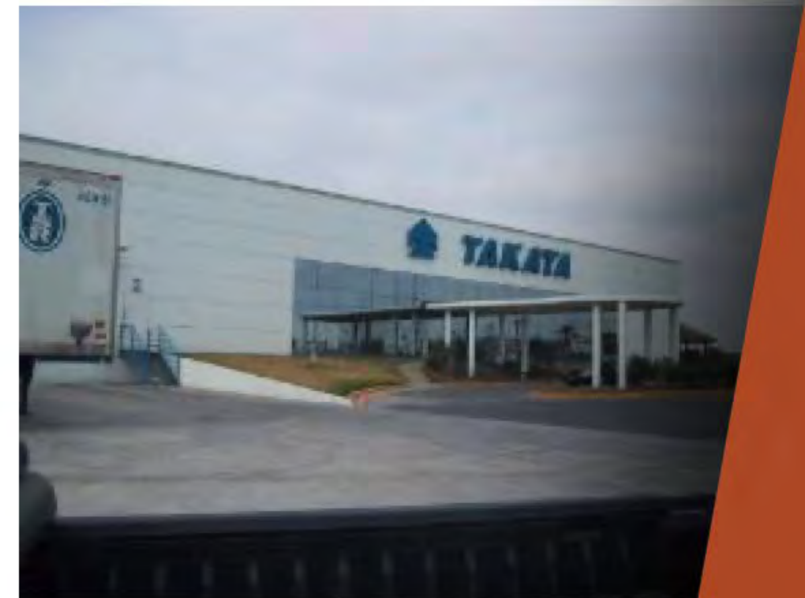
TAKATA PARQUE INDUSTRIAL STIVA AEROPUERTO APODACA, N.L..