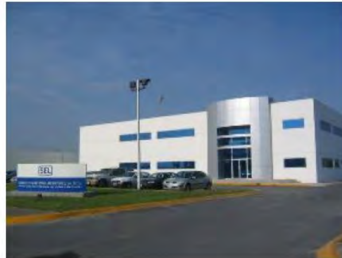
SEL PARQUE INDUSTRIAL STIVA AEROPUERTO APODACA, N.L..