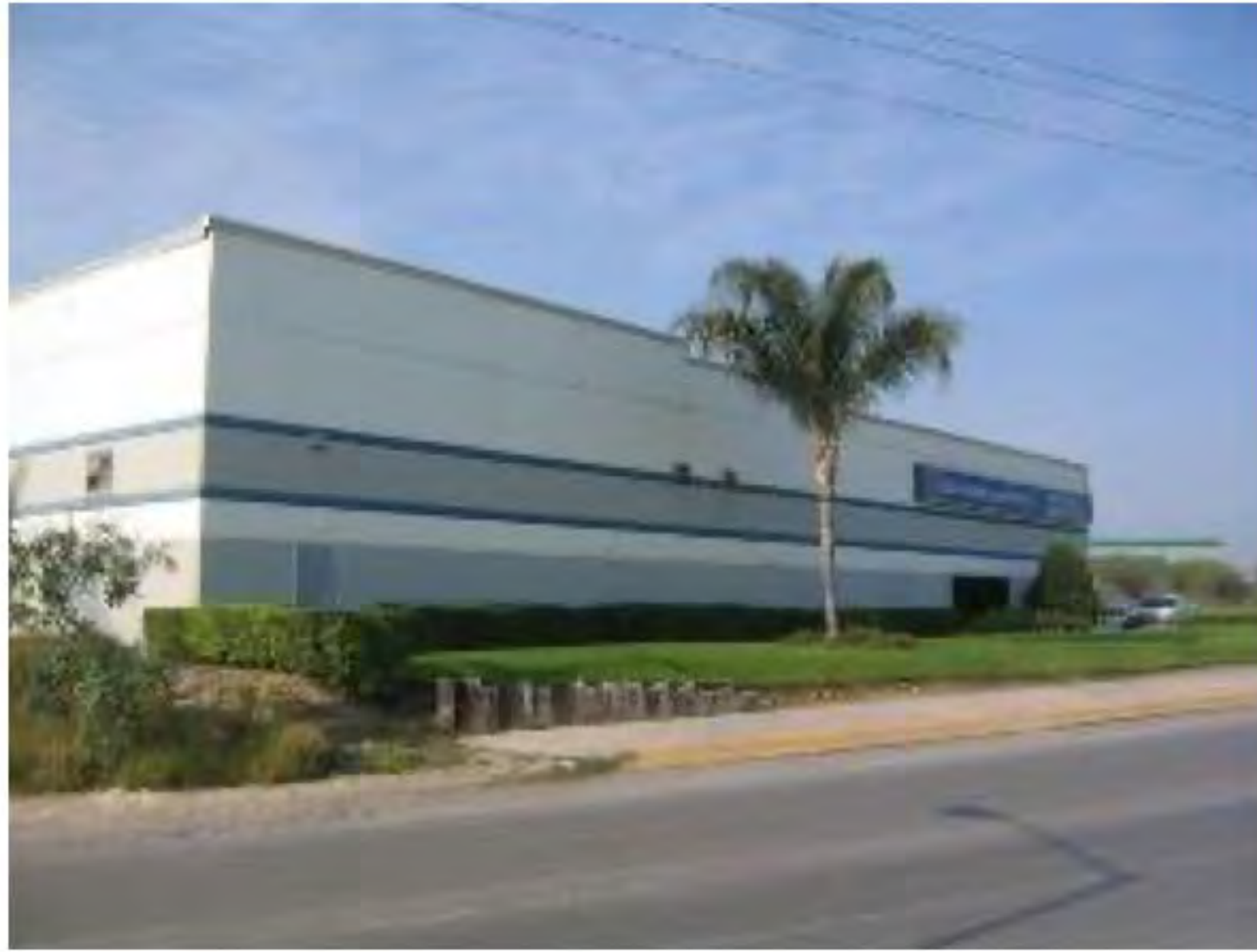
SHERWIN WILLIAMS PARQUE INDUSTRIAL STIVA AEROPUERTO APODACA, N.L..