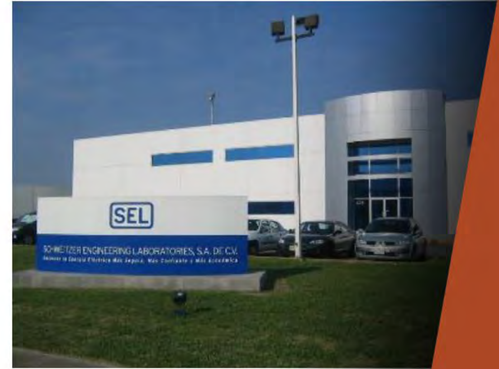
SEL PARQUE INDUSTRIAL STIVA AEROPUERTO APODACA, N.L..